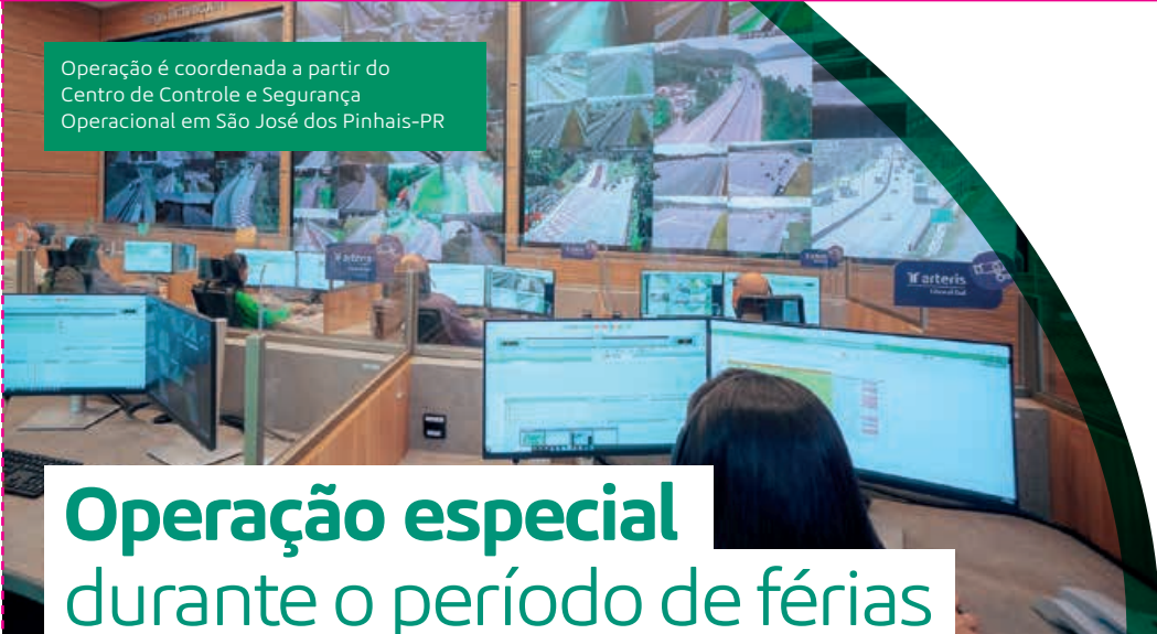
Operação é coordenada a partir do Centro de Controle e Segurança Operacional em São José dos Pinhais-PR