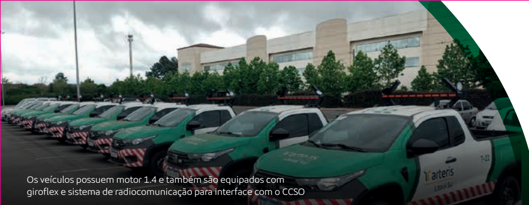
Os veículos possuem motor 1.4 e também são equipados com giroflex e sistema de radiocomunicação para interface com o CCSO