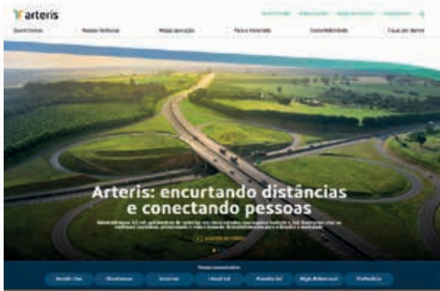
Novo site traz informações atualizadas sobre a concessionária Arteris Litoral Sul