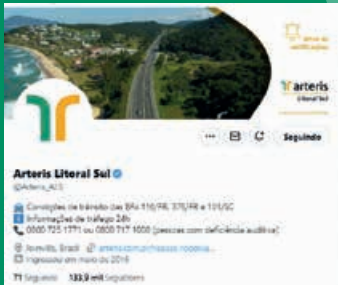
Página no twitter tem informações 24h sobre trânsito no trecho da Arteris Litoral Sul

A Arteris Litoral Sul mantém o perfil no twitter @Arteris_ALS atualizado 24h sobre as condições de trânsito nas rodovias BR-116/Contorno Leste, BR-376/PR e BR-101/SC, na rota de ligação entre as capitais Curitiba e Florianópolis. Atualmente são mais de 130 mil seguidores conectados ao canal, e você não precisa ser um usuário da plataforma para ter acesso às informações, basta acessar o link twitter.com/Arteris_ALS .