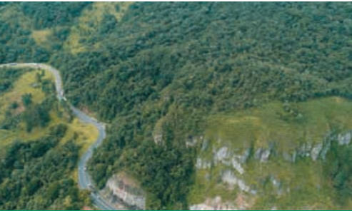
O segmento teve o conceito “bom” como classificação geral, repetindo a mesma classificação “bom” para itens específicos como pavimento, sinalização e geometria.

Os usuários que gostam de saber tudo o que está acontecendo nas rodovias Arteris – agora tem à disposição uma nova versão do site da companhia. Construído com um design mais moderno e de fácil navegação, a proposta da empresa é a de intensificar a entrega de informações importantes aos usuários de forma ainda mais transparente e ágil. O endereço do site é www.arteris.com.br e também é possível acessar diretamente a página da concessionária via https://www.arteris.com.br/nossas-rodovias/planalto-sul/apresentacao/ .