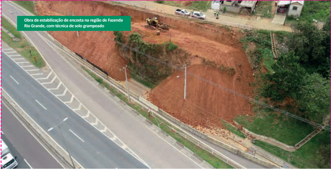
Obra de estabilização de encosta na região de Fazenda Rio Grande, com técnica de solo grampeado