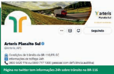
Página no twitter tem informações 24h sobre trânsito na BR-116

A Arteris Planalto Sul mantém o perfil no twitter @Arteris_APS atualizado 24h sobre as condições de trânsito na BR-116, na rota de ligação entre as cidades de Curitiba-PR e Lages-SC. Atualmente são mais de 15 mil seguidores conectados ao canal, e você não precisa ser um usuário da plataforma para ter acesso às informações, basta acessar o link twitter.com/Arteris_APS .