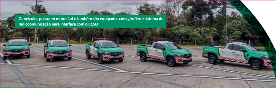
Os veículos possuem motor 1.4 e também são equipados com giroflex e sistema de radiocomunicação para interface com o CCSO