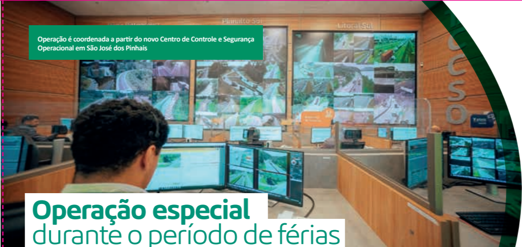
Operação é coordenada a partir do novo Centro de Controle e Segurança Operacional em São José dos Pinhais